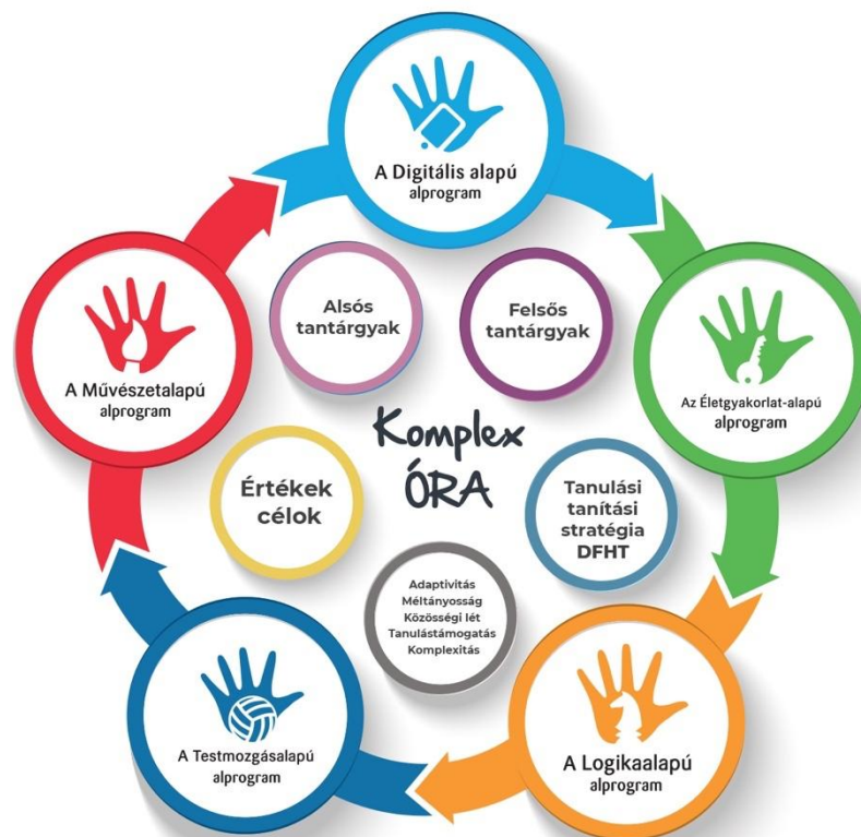
A Komplex órák felépítése